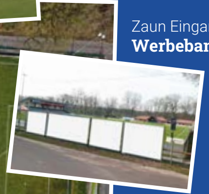
Zaun Eingang Werbebanner